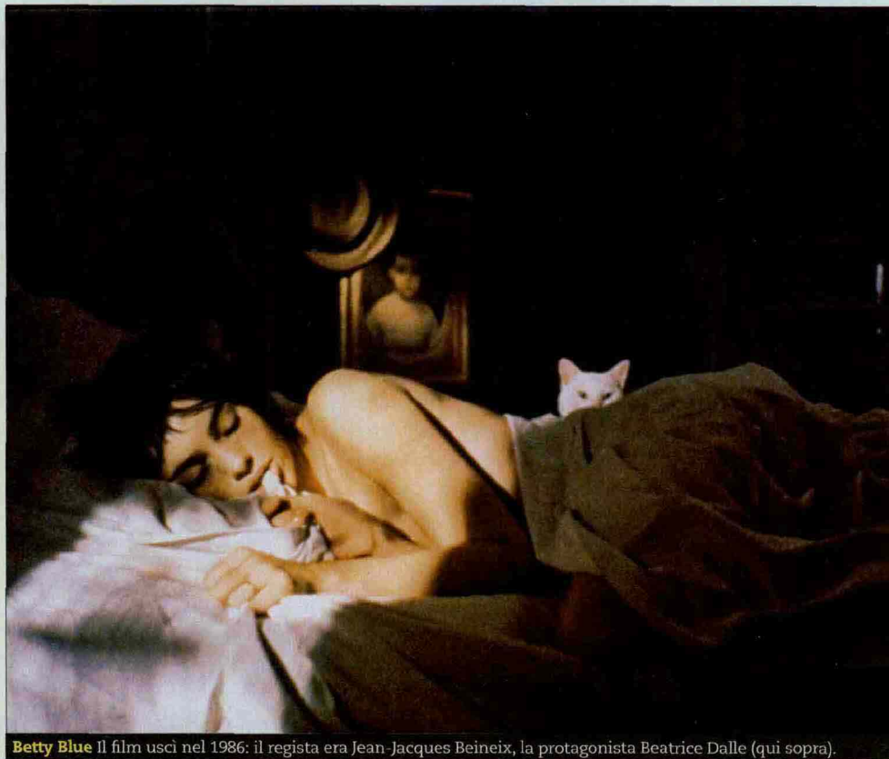
Betty Blue il film uscì nel 1986: il regista era Jean-Jacques Beineix, la protagonista Beatrice Dalle (qui sopra).

Francis, scrittore sessantenne, non scrive più da quando, anni prima, sono morte in un incidente la moglie e una figlia. Quando la figlia sopravvissuta scompare lasciando il marito e le due bambine, Francis scoprirà un mondo dove ogni perdono è impossibile. O forse no. Imperdonabili diventerà presto un film, diretto da André Téchiné ( L'età acerba , Les Voleurs ).