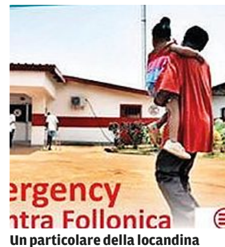
Emergency incontra Follonica. Un particolare della locandina