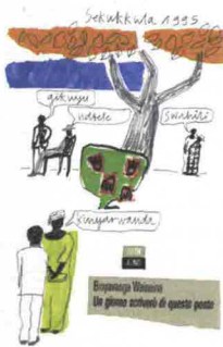
UN GIORNO SCRIVERÒ DI QUESTO POSTO B. Wainaina, 66thand2nd, pag. 290, € 18